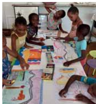
Begeistert von ELS