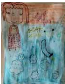
Blue for Paradise