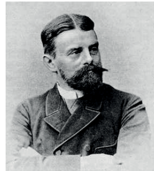
Detlev v. Liliencron um 1883

im Nachlass Dehmel, einsehbar in Dehmel digital: >Ein mir bisher unbekannter Walden, ein Musiker aus Berlin war nämlich bei mir mit seiner Frau - - früher Else Lasker. Ein klein Judenweiblein, elend, mager, mit großen Augen; Else die Tichterin ! [sic]