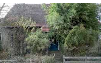
In diesem früheren Schulhaus von 1896 lebte Sarah Kirsch