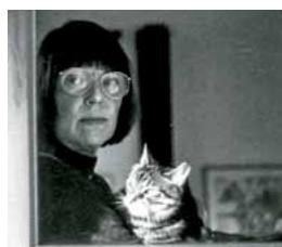
Sarah Kirsch, 1935 – 2013